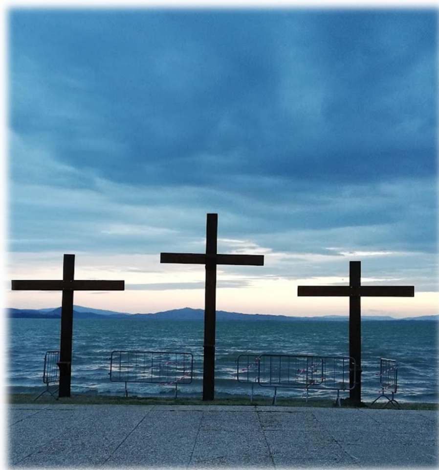
Via Crucis 2023 - preparazione